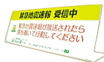
周知広報用スタンド