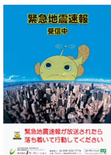
周知広報用ポスター A3 サイズ

また、ご希望のお客さまには、年1回更新用の周知広報用ポスターを無償でお送りいたします。